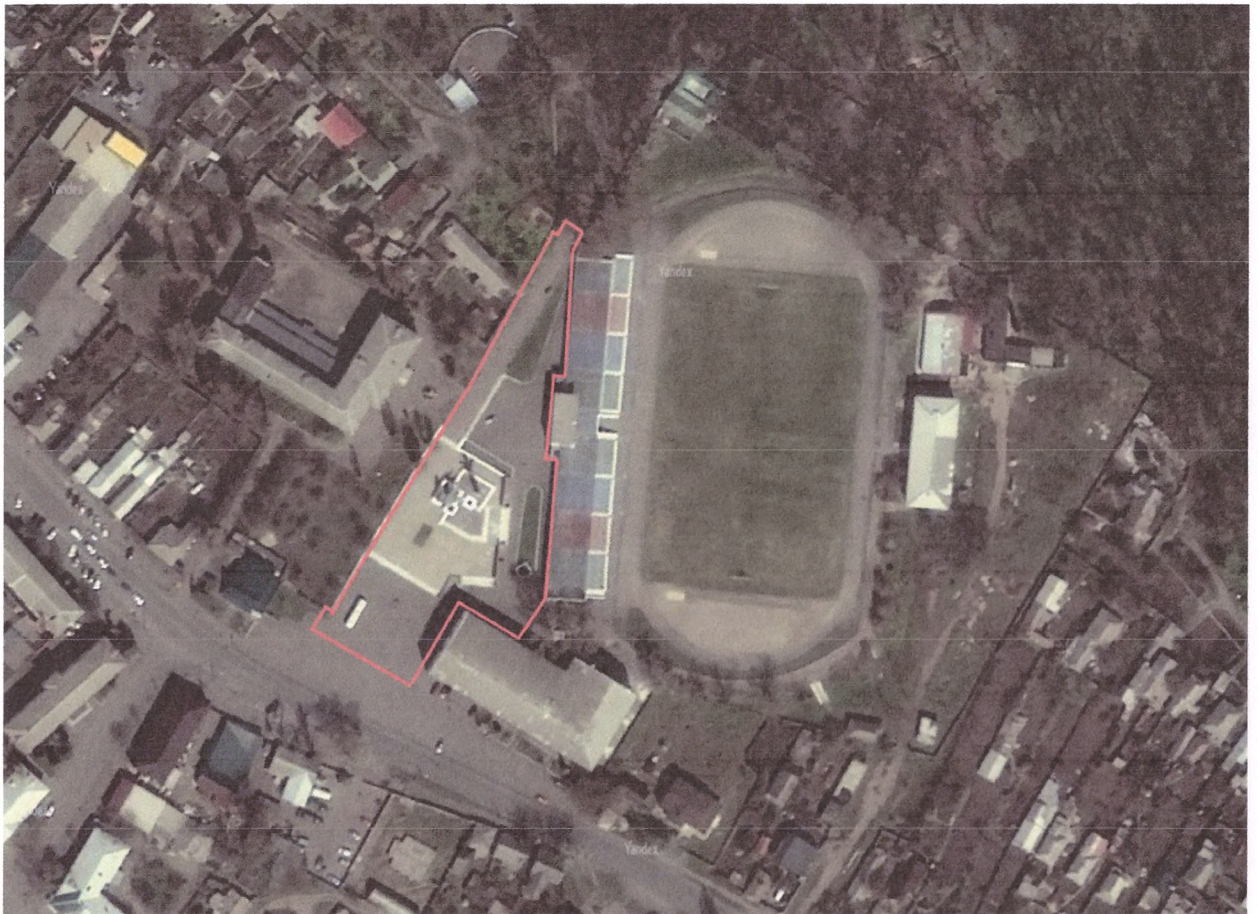
Схема расположения элемента улично-дорожной сети: Российская Федерация, Луганская Народная Республика, городской округ город Ровеньки, город Ровеньки, площадь Республики Коми

Приложение к постановлению Администрации городского округа муниципальное образование городской округ город Ровеньки Луганской Народной Республики от « 14 » 02 2025 № 80-н/25